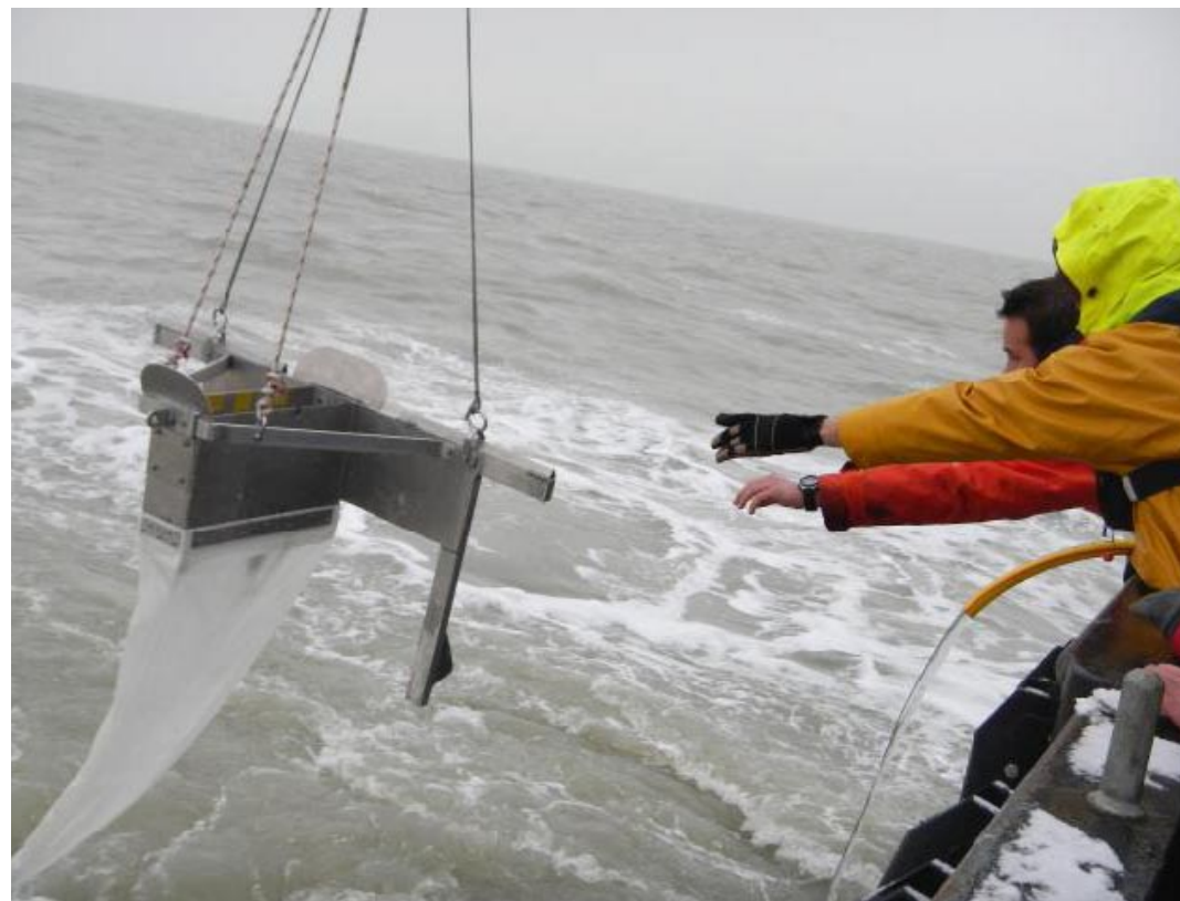
Bemonstering van microplastics op zee.

Ook hoogleraar Waterkwaliteit Bart Koelmans doet onderzoek naar het vóórkomen en de effecten van (nano)plastics op zee. Hij is verbonden aan de Wageningen Universiteit en IMARES. In 2012 publiceerde hij over de effecten van nanoplastics op mosselen. Inmiddels is er vervolgonderzoek gestart. Koelmans: 'We kijken naar de effecten van micro- en nanoplastics op mosselen, vissen en plankton. Het gaat om een reeks complexe interacties tussen (nano)plastics, fytoplankton, zoöplankton en vissen. Specifiek voor mosselen onderzochten we welke concentraties plastics een negatief effect hebben op het voedingsgedrag. Als de